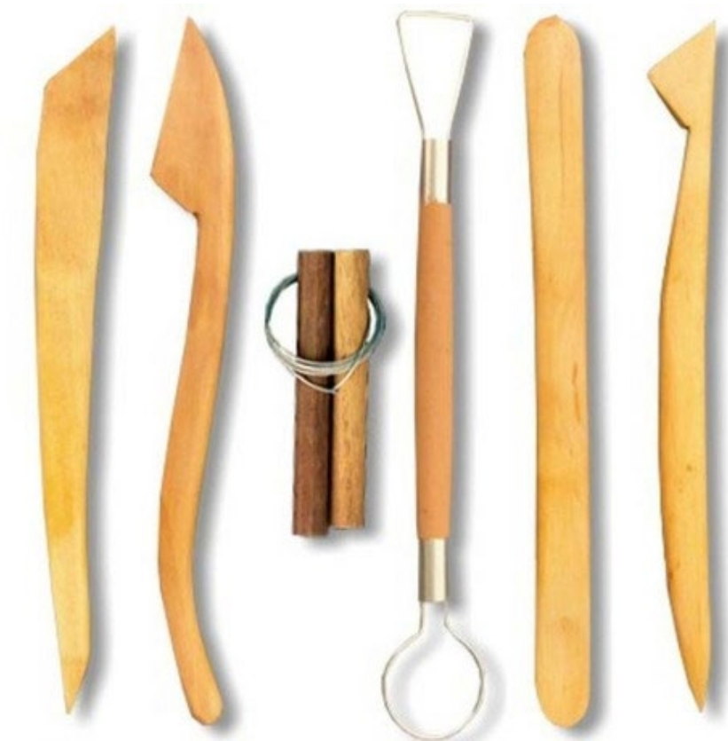
Estecas para modelar