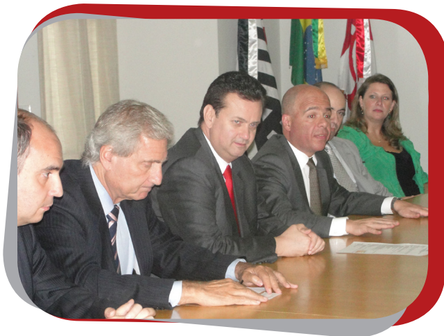
Alunos de parceria internacional da FMU são recebidos pelo prefeito Gilberto Kassab.

Um bom exemplo desta prática é a cooperação estabelecida entre a FMU e a FIESP e entre a FMU e a SPTuris, três grandes organizações envolvidas com a melhoria das condições de produção (Produção Mais Limpa) e com a manutenção da vitalidade dos ambientes destinados ao convívio humano na região em que se encontram os Campi da Instituição. A coleta seletiva de resíduos, programas de redução no gasto de energia elétrica, de água e insumos, associados a políticas de produção mais limpa fazem parte do contexto no qual a FMU apresenta sua atenção para com questões de defesa ambiental. Na mesma linha, os cursos são estimulados a estabelecerem ações que privilegiem o patrimônio histórico e a produção artística.